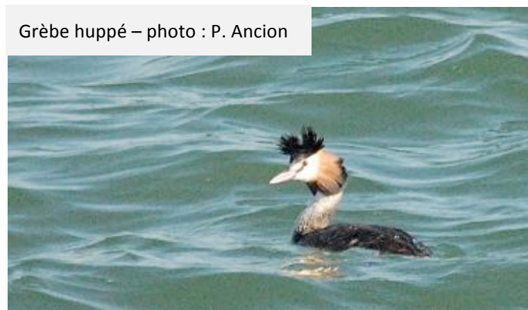
Grèbe huppé

Nous avons poursuivi notre route vers Batz sur mer puis le Croizic et après avoir traversé le bourg, nous nous sommes arrêtés non loin de l'aquarium près de la station SNSM, pour accéder à la grande jetée qui protège l'entrée du port du Croizic. Sur les bancs de sable découverts au milieu des chenaux, coté Pen Bron, on a pu admirer de nombreux Huîtres pie, des Barges rousses, des Sternes caugek, des Grands Cormorans, des Goélands argentés ainsi que des Bécasseaux sanderling. Au bord de la digue, quelques Grèbes huppés se sont laissés admirer pendant que nous revenions vers la station SNSM qui mettait à l'eau son canot pour exercice.