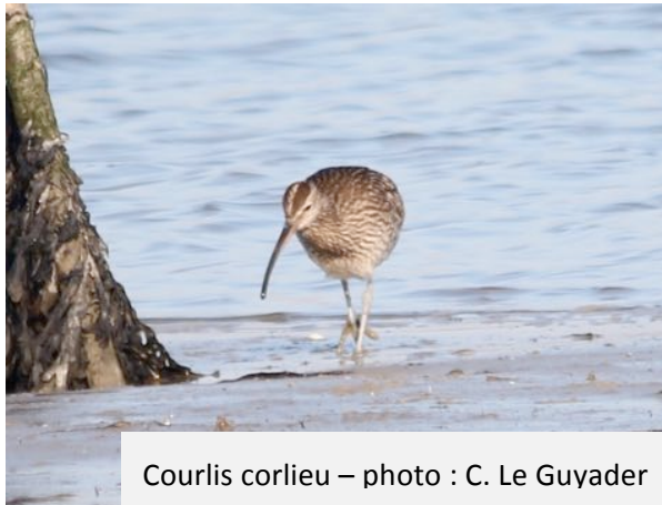
Courlis corlieu

- une Harelde boréale, un Goéland cendré, un Courlis corlieu qui a déclenché un « waouh » général car c'était le 1er observé de ce début d'année.