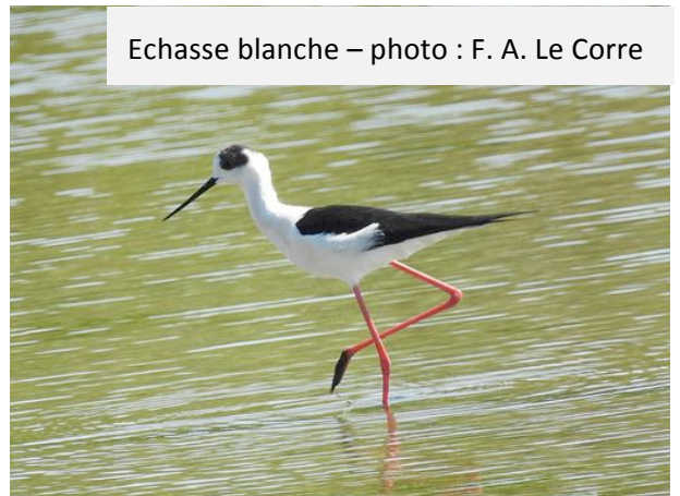
Echasse blanche

Nous avons essayé d'aller jusqu'à la pointe de Pen Bron, mais les parkings étant pleins et la mer déjà haute ne laissaient pas entrevoir des observations particulières. Nous sommes donc rentrés par le barrage d'Arzal où nous avons fait une petite halte afin de prendre un pot avant de rentrer sur Vannes. . Une journée baignée de soleil et des paysages toujours intéressants à découvrir.