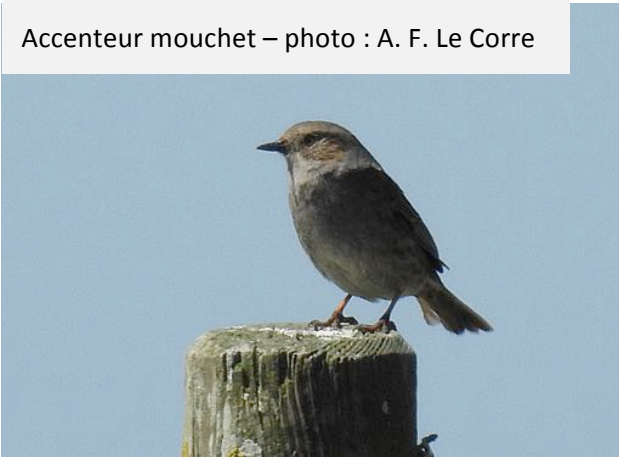
Accenteur mouchet