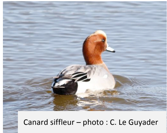
Canard siffleur

le passage de 3 kayakistes sur la rivière a fait disperser tout le groupe, mais nous a permis d'assister à un magnifique envol d'Avocettes et de Canards siffleurs.