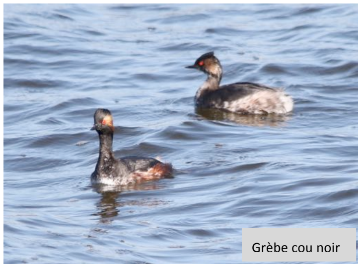
Grèbe cou noir