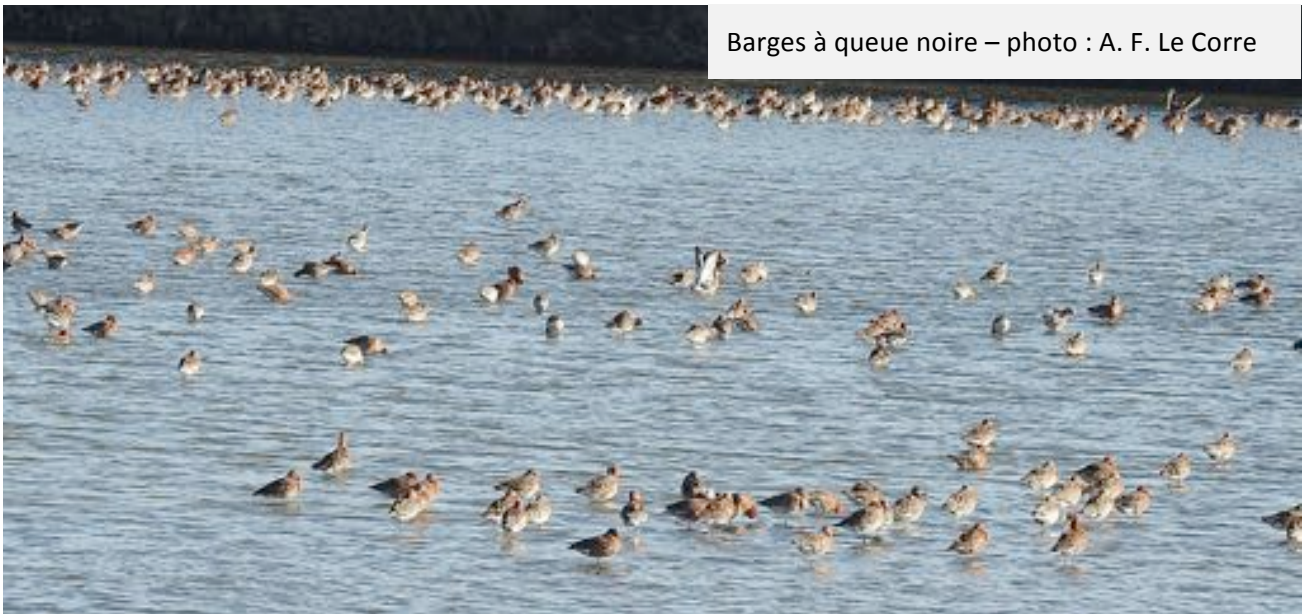
Barges à queue noire

Une fois passé Guérande, le petit convoi de quatre véhicules s'est arrêté subitement à la hauteur des premiers marais salants de Saillé pour admirer dans une claire, au bord de la route, un véritable îlot de Barges à queue noires ensommeillées (500 environ), dont une bonne majorité était en plumage nuptial.