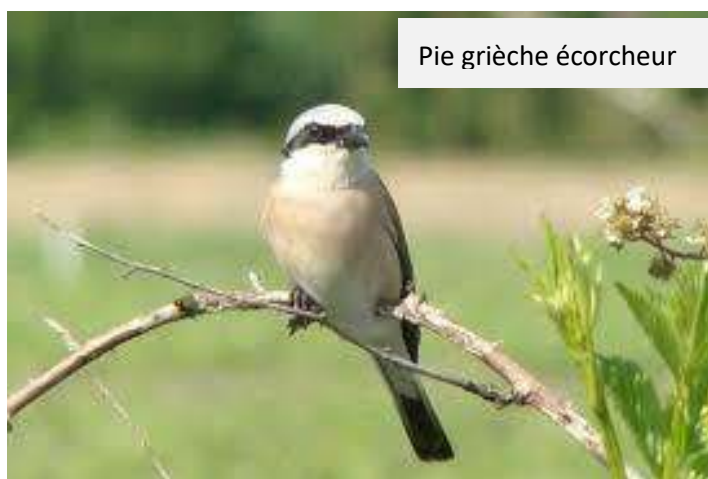
Pie grièche écorcheur