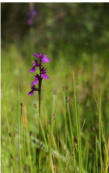
Orchis des marais