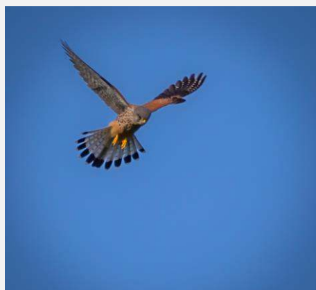
Faucon crécerelle

En vol, un Héron cendré et une Buse variable, un Tarier pâtre mâle puis 2 Faucons crécerelles au-dessus des arbres, 2 Buses posées sur 2 poteaux à côté d'une maison jaune puis en vol, dérangées par une Corneille noire agitée.