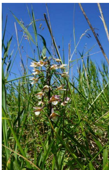
Epipactis des marais