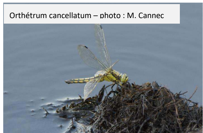
Orthétrum cancellatum

Embarquement immédiat en direction d'une héronnière coiffée de quelques Grands Cormorans. « Cormoranière », ce serait plus juste. Les fientes ont décimé les branches et dessiné des moignons. L'eau en interdit l'accès. On devine plus qu'on ne voit. Bifurquons. La Guifette se mérite, mon garçon. La déception nous poursuit. La réserve Pierre Constant est fermée. Là aussi force est d'imaginer. On aperçoit au loin quelques Oies cendrées, des Vanneaux huppés, et, battant le pavé, des Bergeronnettes juvéniles agitées. Court la rumeur d'une Gorgebleue. Qui monte et qui descend ? Confirmée. Denis l'a vue. Elle était là et si tôt disparue.