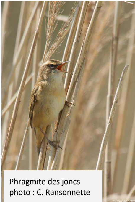
Phragmite des joncs

Après un départ quasi militaire, vingt cinq drôles de curieux oiseaux se retrouvent non sans peine à Kerfeuille, un joli petit port marécageux. Il fait beau et frais. L'eau clapote le long de l'herbe des rives. Dérangées, de jeunes Gallinules poules d'eau se faufilent à l'abri des berges. Un Busard goguenard daigne à peine leur jeter un regard. Une élégante Aigrette garzette, de son pas délicat, pêche et piétine, ignorant le majestueux Milan noir tout à sa chasse et qui plane. On entend le Phragmite des joncs qui s'agite et craquette à la cime des fourrés. Un peu plus loin on s'attroupe, quelque chose frémit sur un bout de tourbe immergé : une sorte de libellule, une femelle Orthétrum, obstinée à butiner la terre. Quelques Foulques macroules croisent au large. Mais point de Guifette, malheureux!